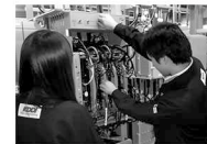
KDDI エンジニアリング(株)