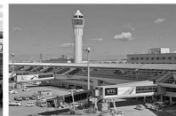
中部国際空港 情報通信株式会社