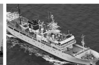
北海道教育委員会 実習船通信士