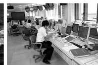
国土交通省 航空局