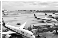
羽田空港 航空保安協会