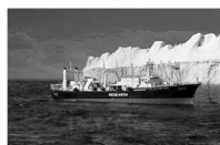
共同船舶株式会社