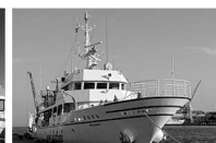
京都府立海洋高校 実習船通信士