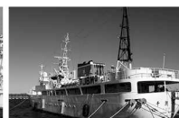
千葉県立館山総合高校 実習船通信士