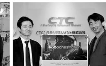
CTCシステム マネジメント(株)