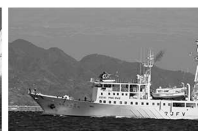
極洋水産株式会社