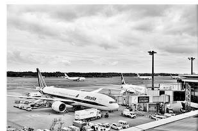
成田空港 航空保安協会